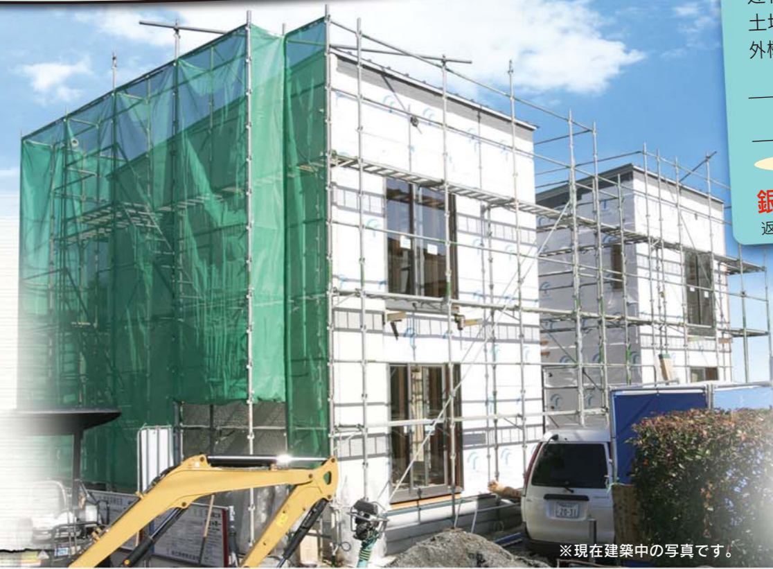
※現在建築中の写真です。

■物件概要 ●所在地/中間市土手/内473-18の一部 ●交通/筑豊電鉄土手/内徒歩7分 ●学区/中間東小学校・中間東中学校 ●土地権利/所有権 ●地目/宅地 ●都市計画/市街化区域 ●用途地域/第二種低層住居専用地域 ●建ぺい率/50% ●容積率/80% ●引渡予定/平成21年3月上旬 ●現状/建築中 ●接道状況/西側6m公道 ●構造/木造在来工法・コシニアル葺・2階建 ●設備/九州電力・公営水道・下水(集中併処理浄化槽) ●集中プロパン ●今回事業区画/2区画(A・B棟、C棟) ●A・B棟/販売価格2,850万円(税込) ●土地面積/204.73㎡ ●建物面積/143.67㎡ ●C棟/販売価格1,480万円(税込) ●土地面積/166.21㎡ ●建物面積/67.07㎡ ●敷地延長共有道路有(幅員3m) ●B棟共有道路有(幅員3m) ●建築確認番号/第H20確申建築福住セ北01766号他 ●広告有効期限/平成21年4月末日 ●九公取(福022)