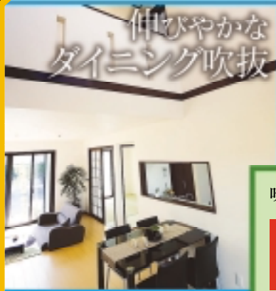
伸びやかな ダイニング吹抜