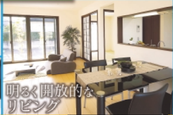
明るく開放的な リビング